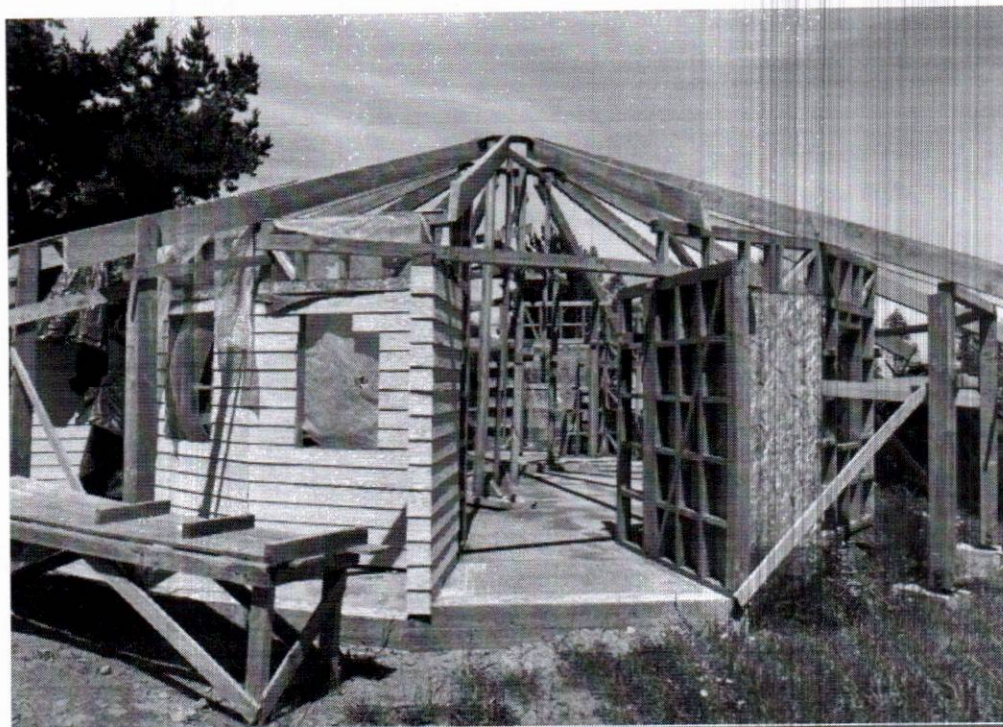
FOTOGRAFIAS SEDE JUAN RANIQUEO II, HUALLEPEN ALTO, CONTULMO