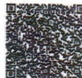
p.p. ProGarantía S.A.G.R

Este certificado se emite en virtud del "Contrato de Garantía Recíproca" suscrito entre ProGarantía S.A.G.R. y el Afianzado y no goza del beneficio de excusión, en conformidad a lo establecido en la Ley N.° 20.179. El presente certificado cubre exclusivamente incumplimientos de la obligación caucionada ocurridos durante la vigencia de este certificado, a menos que se indique explícitamente lo contrario. El cobro de este certificado solo podrá ser realizado por el Acreedor hasta la fecha de vencimiento señalada, después de este plazo caducarán los derechos de este último. Este certificado no devenga intereses ni reajustes. El presente certificado de fianza no admite ninguna modificación a sus condiciones originales y garantiza exclusivamente la obligación caucionada indicada anteriormente.