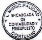
YENNY CONEJEROS INZUNZA ENCARGADA DE CONTABILIDAD Y PRESUPUESTO

PRESUPUESTO PROYECTO DE INVERSIÓN REPARACIÓN CEMENTERIO MUNICIPAL, CONTULMO AL 22/03/2023